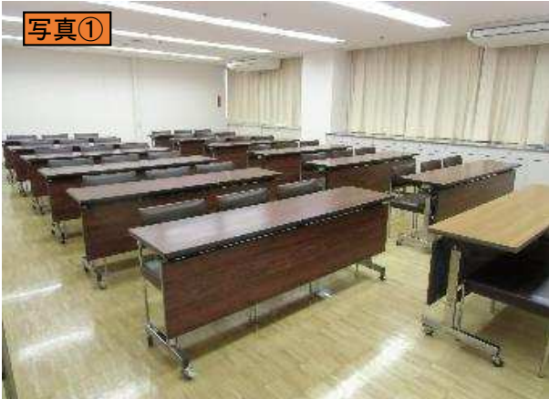
出入口ドアから室内