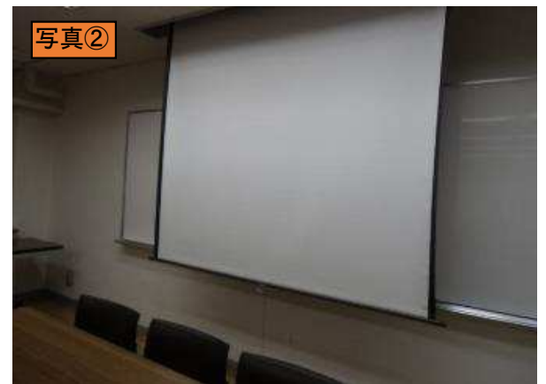
常設スクリーンを降ろしたところ