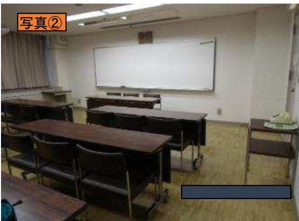
ホワイトボード(固定式)