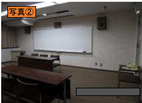
ホワイトボード(固定式)