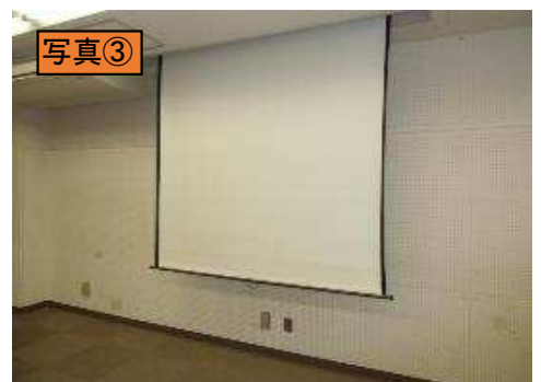
常設・南スクリーンを降ろしたところ (室後方)