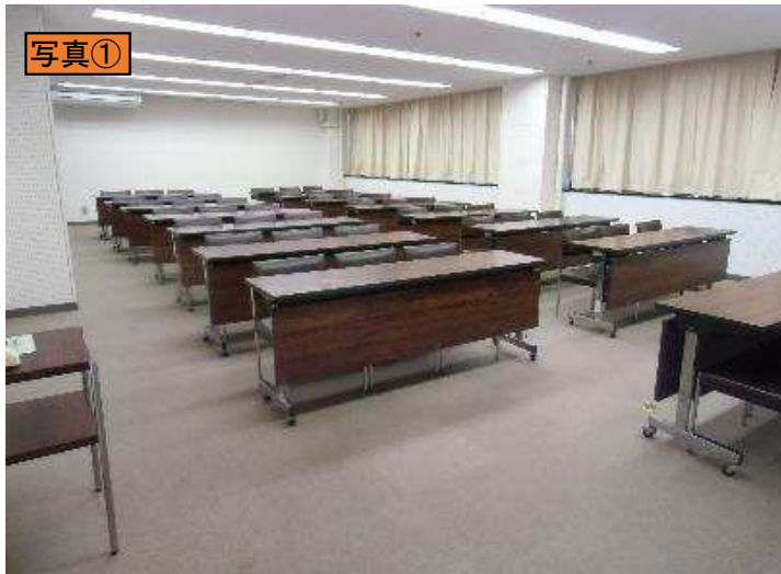
出入口ドアから室内