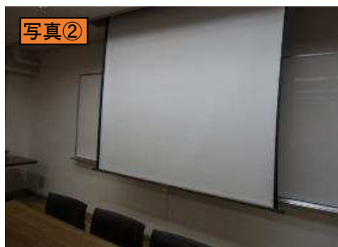
常設・北スクリーンを降ろしたところ