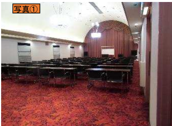
写真① ホール後方(北東)から、演台方向