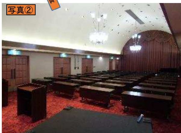
写真② ホール前方(南西)から、出入口ドア方向