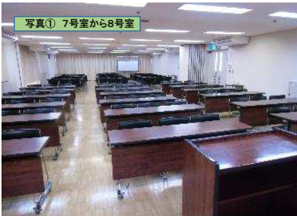
写真① 7号室から8号室