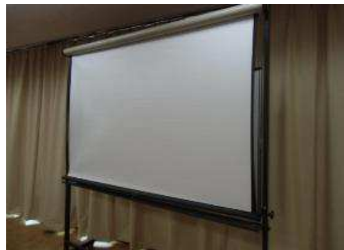
キャスター付き常設ホワイトボード併設スクリーンを降ろしたところ