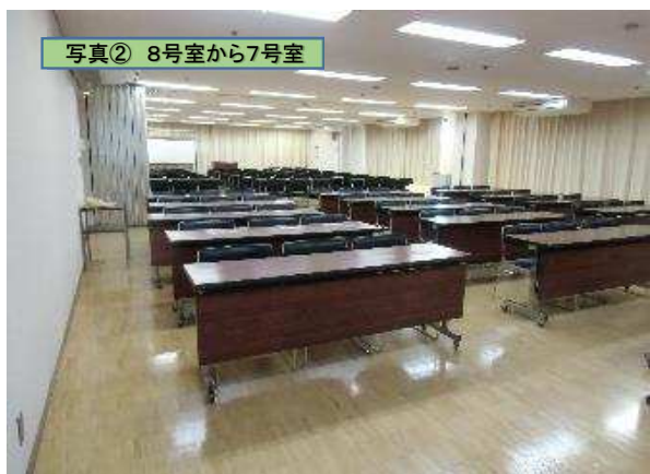
写真② 8号室から7号室