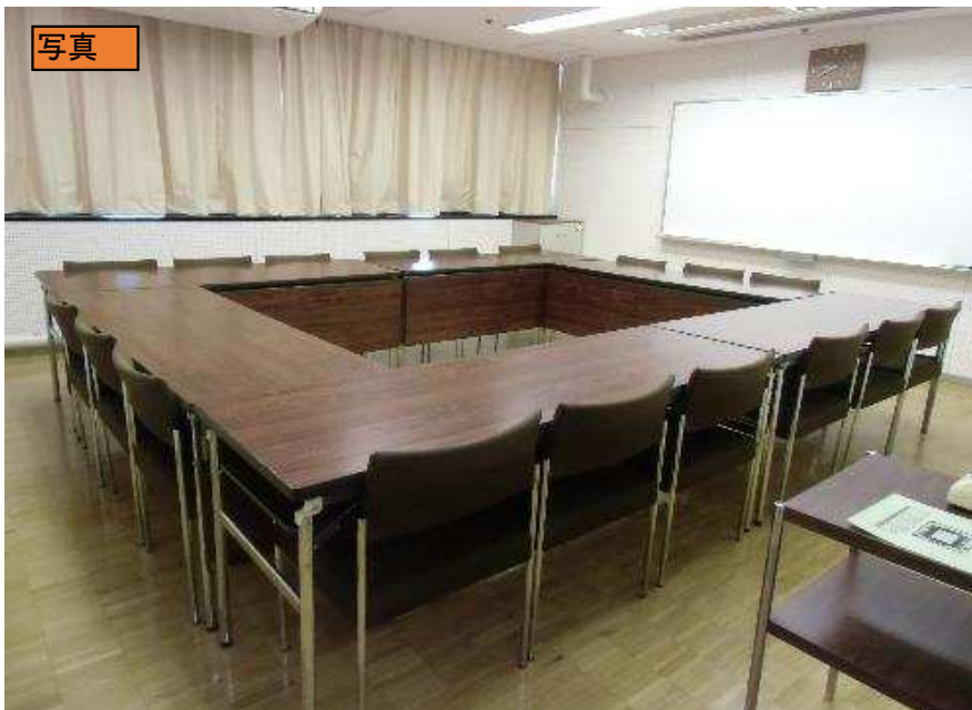
出入口ドアから室内