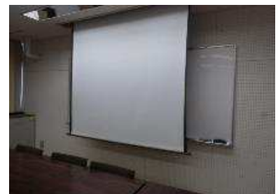
常設スクリーンを降ろしたところ