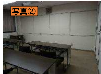
ホワイトボードを覆う両開戸