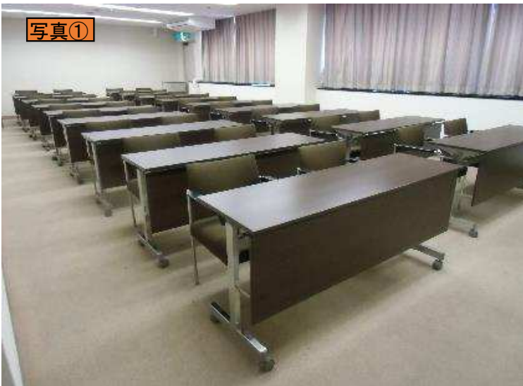
南側出入口ドアから室内(北東奥に非常扉)