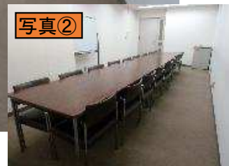
東の窓付近から出入口方向